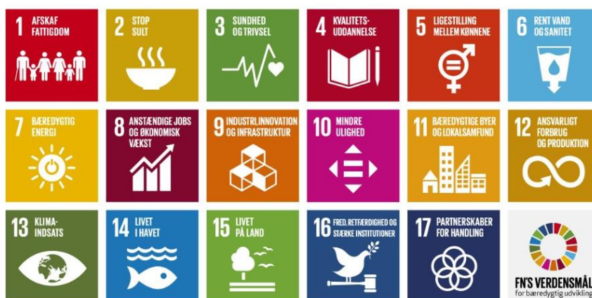
Figur 2. FNs 17 verdensmål for bæredygtig udvikling [4]

I denne rapport anvendes forskellige begreber alt efter sammenhængen. Men i forbindelse med Medicinrådets mulighed for at inddrage bæredygtighedsaspektet er det i første omgang klima- og miljøaftryk, vi har fokus på.